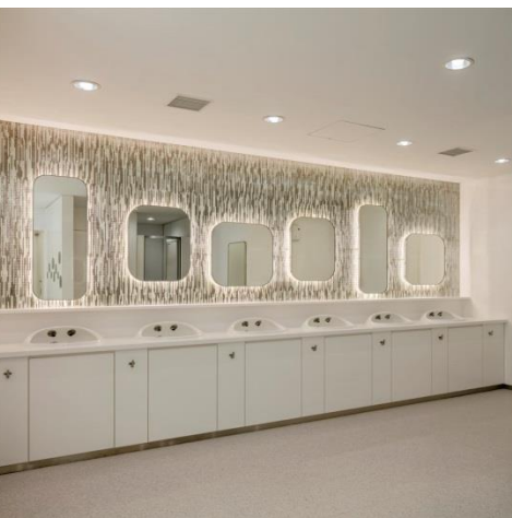
リニューアルした3階女性トイレ